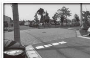
公園前は一時停止指導線のみ