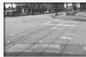
横断歩道がほとんど見えない