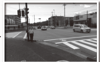
横断歩道がくっきり