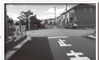
優先道路が明確に