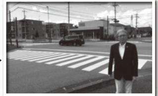
横断歩道の補修完了