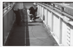
ラバーが亀裂等の傷み