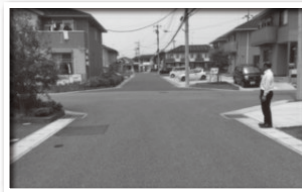
交差点は規制なし