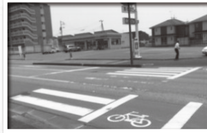
消えている横断歩道