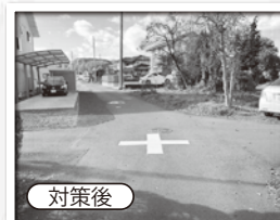
東西の優先道路からも交差点標示を認識