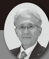
栃木県議会議員 野澤和一