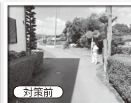
見通しが悪い交差点