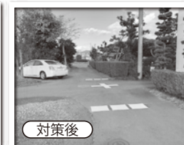
交差点標示と停止指導線(北進方向)