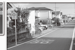
ゾーン30の標識と道路標示