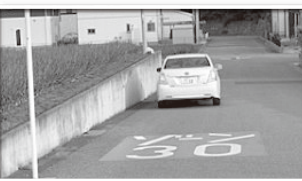
分譲地内の安全確保