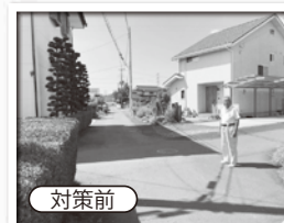
地元自治会長と現場を調査

12月1日、宇都宮市中里原町内の消防学校からの交差点、地元自治会から安全対策を要望され「交差点あり注意」及び「停止指導線」の敷設が完了。対策前は、道路標示は無く、出会い頭の交通事故が多発。地域外からのドライバーが多く、地域住民が巻き込まれるケースが多かった。対策後、交差点中心部に「交差点あり注意」の道路標示と、南進・北進側に「停止指導線」を敷設。消防学校からの通りを優先道路とした。自治会長はじめ自治会の皆様には、大変喜んでいただいています!!