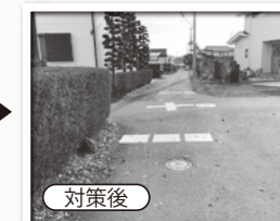
交差点標示と停止指導線(南進方向)