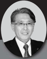
栃木県議会議員 野澤和一