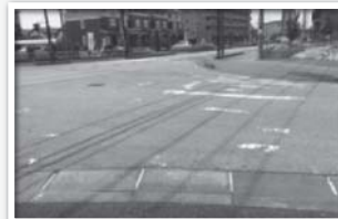
横断歩道がほとんど見えない