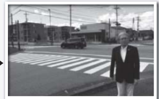
横断歩道の補修完了