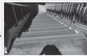
ラバーと滑り止め補修