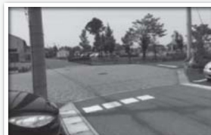
公園前は一時停止指導線のみ