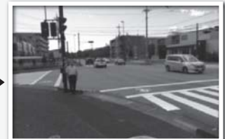
横断歩道がくっきり