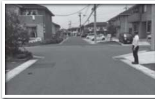
交差点は規制なし