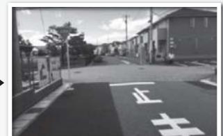
優先道路が明確に