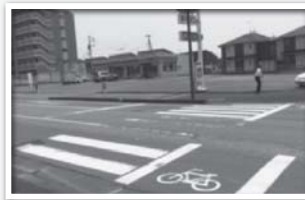
消えている横断歩道