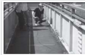
ラバーが亀裂等の傷み