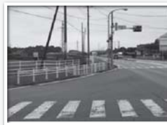
通学路全体にガードレール設置完了