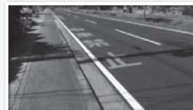
店舗駐車場前の駐車禁止