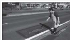
振動の原因の凹み