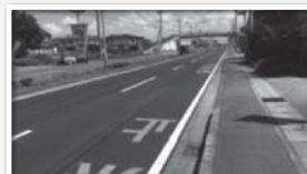
改修後、振動・騒音なし