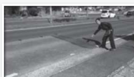
騒音の原因の段差

石橋真岡線(バイパス)の道路改修工事が完了。地元から、石橋真岡バイパスの道路の傷みによる振動や騒音で、夜も眠れないとの声を頂き調査。亀裂や穴、段差等で、傷みが進んでいました。今回の全面的改修で、沿線や周辺の民家から、振動や騒音が消えたと、喜んで頂きました。