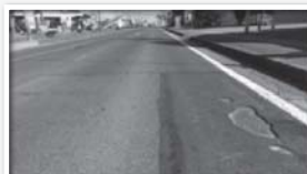
約300mに渡り傷みが進んでいた