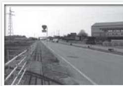
交通が多いバイパスだが 安全対策が不備

明治南小学校通学路の安全対策のため、2016年2月に現地を調査。歩道が狭くガードレール設置が困難なため、県と対策を協議し、歩道拡幅整備の後ガードレール設置の方針を決定。二年がかりで歩道を拡幅し、この度、歩道にガードレール設置が完了しました。地元自治会や小学校、PTAから、喜びの声を頂きました。