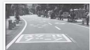
通学路の安全確保のための道路標示