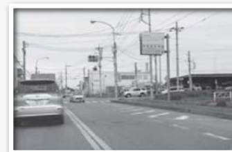
相互単車線で、右折時に支障