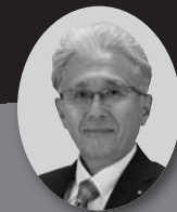
栃木県議会議員 野澤和一