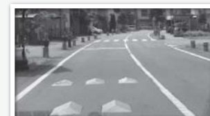
通学路の安全確保のための道路標示