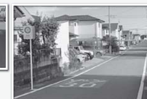
ゾーン30の標識と道路標示