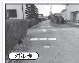
交差点標示と停止指導線(南進方向)