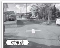
東西の優先道路からも交差点標示を認識