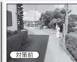
見通しが悪い交差点