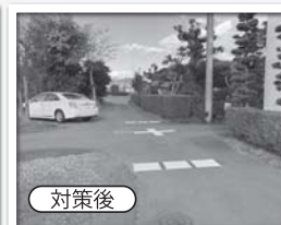
交差点標示と停止指導線(北進方向)