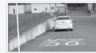
分譲地内の安全確保