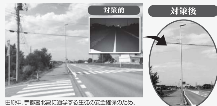
田原中、宇都宮北高に通学する生徒の安全確保のため、道路灯を設置しました。

田原街道バイパスを通学時に利用する、中学・高校生の夜間帰宅時の安全対策「道路灯」設置が実現した。これは、地元住民やPTA保護者の皆様から、防犯対策及び交通事故防止対策を要望され、行政と協議し対応した。田原街道バイパスへの道路灯設置は、北部エリアに1ヶ所の設置。道路灯の設置基準は、交差点(大・小不問)の有る場所とあり、バイパス沿線ではこの1ヶ所となる。