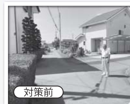
地元自治会長と現場を調査

12月1日、宇都宮市中里原町内の消防学校からの交差点、地元自治会から安全対策を要望され「交差点あり注意」及び「停止指導線」の敷設が完了。対策前は、道路標示は無く、出会い頭の交通事故が多発。地域外からのドライバーが多く、地域住民が巻き込まれるケースが多かった。対策後、交差点中心部に「交差点あり注意」の道路標示と、南進・北進側に「停止指導線」を敷設。消防学校からの通りを優先道路とした。自治会長はじめ自治会の皆様には、大変喜んでいただいています!!