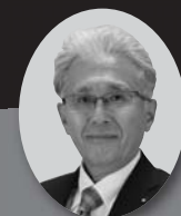
栃木県議会議員 野澤和一