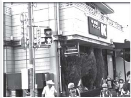
登校時、青の時間が10秒延長