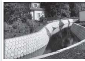
整備された赤沢川護岸