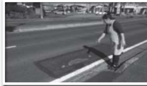
振動の原因の凹み