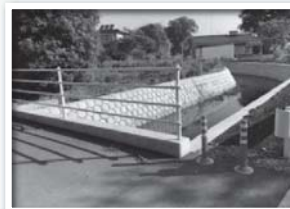
護岸が改修された赤沢川