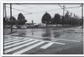
交差点の北西に水溜り