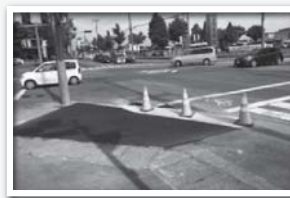
北西の凹みを補修