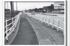
通学路全体にガードレール設置完了