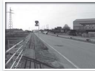
交通が多いバイパスだが 安全対策が不備