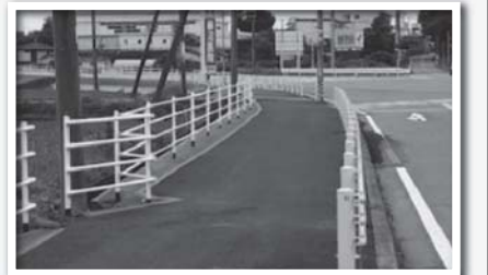
安全が確保された