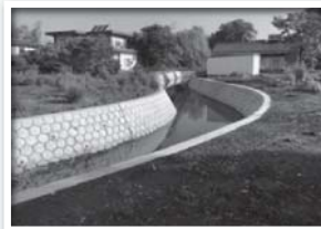
護岸整備が進み住民生活の安全が確保