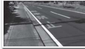
店舗駐車場前の駐車禁止