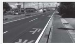
改修後、振動・騒音なし