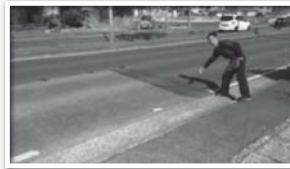
騒音の原因の段差