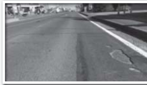
約300mに渡り傷みが進んでいた